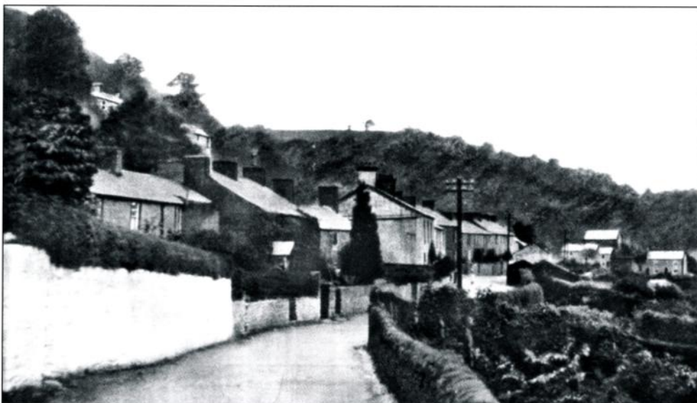
Hen bentref Gwaelod-y-garth