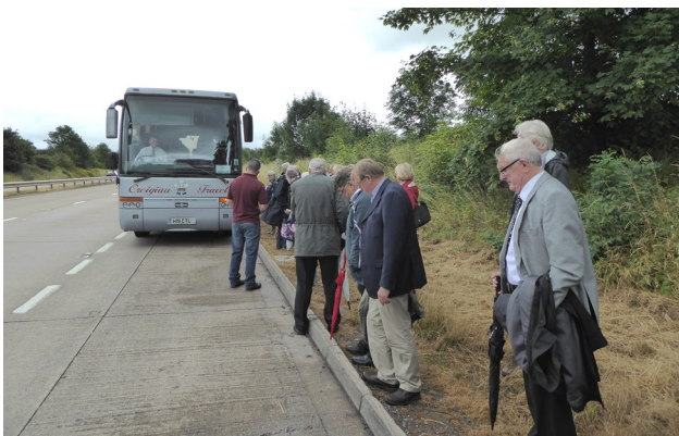
Bws yn torri lawr ar y ffordd i Eisteddfod Y Fenni 2016