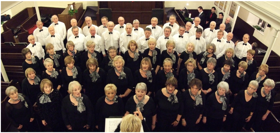
Bethlehem, Gwaelod y Garth 2012