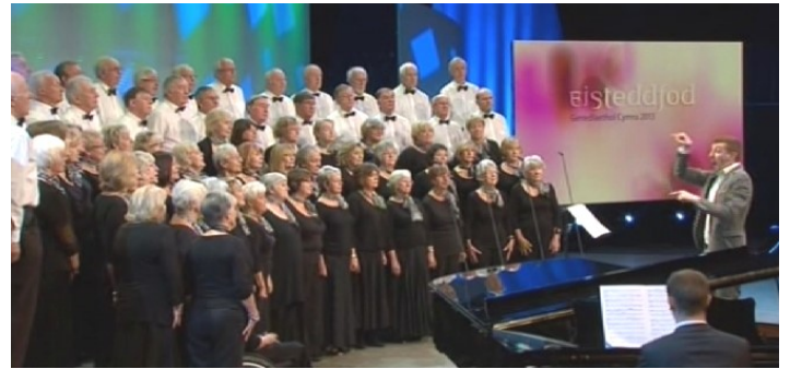
Eisteddfod Dinbych 2013

Mae dathlu yn hanfodol ar ôl gweithio mor galed ac mae angen sicrhau lleoliad neu westy addas ar gyfer noson y cystadlu. Ym Meifod glaniwyd mewn pabell ar gae rygbi ac yn ogystal a mochyn wedi'i rostio cafwyd gwledd o gabaré yn bennaf gan ddynton y côr.