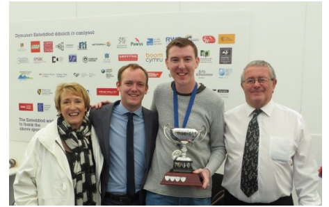
Ennill yn Eisteddfod Meifod 2015