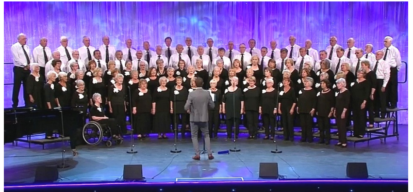
Eisteddfod Ynys Môn 2017

Mae'r côr wedi ennill y Gystadleuaeth Gorawl i Bensiynwyr yn 2010, 2011, 2012, 2013 a 2014 (o dan yr enw Côr y Mochyn Du) ac yn 2015, 2016 a 2017.