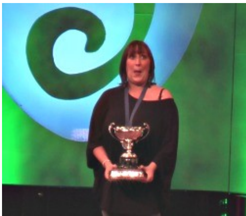
Ennill am y tro cyntaf yn Eisteddfod Glyn Ebwy 2010