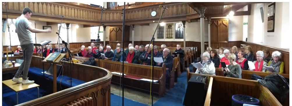
Recordio pymtheg emyn ar gyfer CD yn y gyfres Hoff Emynau, Chwefror 2018