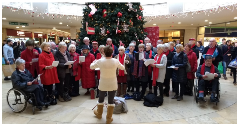
Canu Carolau tuag at Cancr y Fron 2017