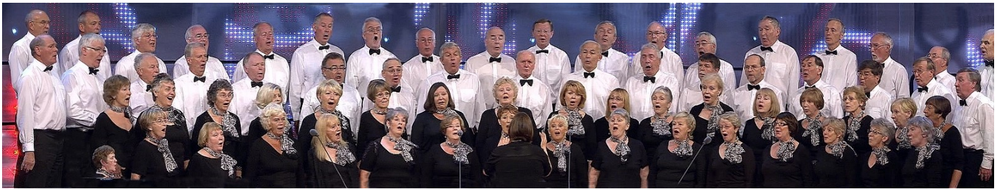
Côr y Mochyn Du yn Eisteddfod 2008