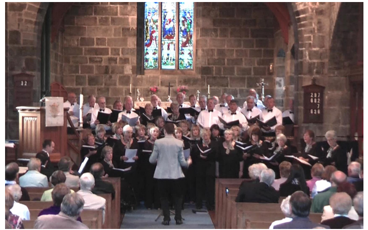
Gŵyl Dinas Powys 2014

Drwy gynnal cyngherddau a gweithgareddau mae'r Côr wedi cefnogi nifer o elusennau yn cynnwys Ysbyty Felindre, Ambiwllans Awyr Cymru, Clefyd y Galon, Cancr y Fron, Cymorth Cristnogol a'r Eisteddfod Genedlaethol.