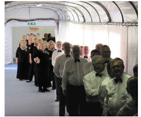
Nerfuswydd yn y twnel, Llanelli 2014