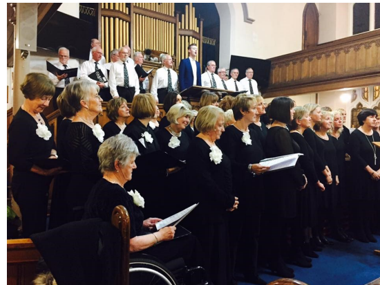
Cyngerdd i elusen Capel Salem gyda Chôr Canna Tachwedd 2016

Diolch arbennig i Gapel Salem, Treganna, am gael defnyddio'r festri ar gyfer yr ymarferion.