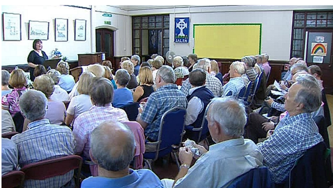
Ymweliad gan griw teledu ITV i ymarfer yn Salem cyn Eisteddfod 2008